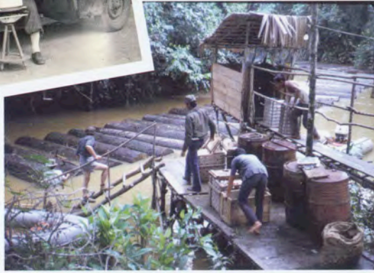
Mission Indonésie en 1970 ▶