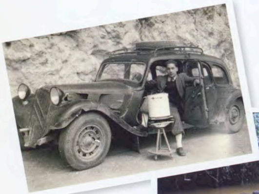
▲ Mission gravimétrique entre Tarbes et Saint-Gaudens en 1947.